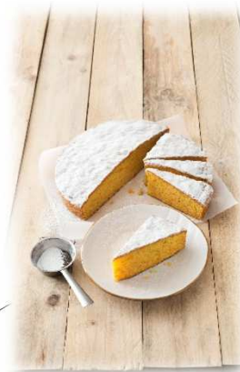
TORTA SOFFICE ALLE CAROTE